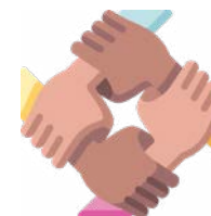
Trabajo en equipo