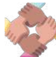
Trabajo en equipo